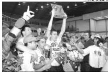
Carlos Barbosa iniciou a grande festa do bi em Canoas

O jogo final do Estadual/Ouro, sábado, foi equilibrado e emocionante. A festa da torcida de Carlos Barbosa, que começou no próprio ginásio da Ulbra estendeu-se por toda a cidade, principalmente após a chegada dos bicampeões. Eles desfilaram num carro de bombeiros.