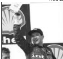
Piloto gaúcho mais uma vez no pódio

9º PÁREO — 1.100m (Areia) — 1º EVEN IMPOSSIBLE (N. Pinto); 2º Fragora. T.: 68'3. V (10) 2,80; P (10) 1,40 e (1) 5,80; DE (101) 33,50; Qr.: (10176) 283,80.